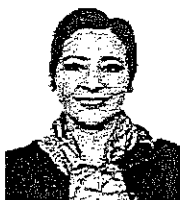
Dip. Fed. Angélica Reyes Ávila