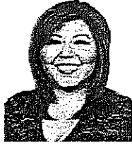
Dip. Fed. Genoveva Huerta Villegas