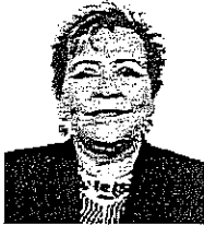
Dip. Fed. María Verónica Muñoz Parra